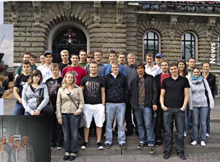
Hafenrundfahrt (links oben), Innenstadt (großes Bild) und Betriebsbesichtigung: Die Auszubildenden lernten die verschiedenen Facetten von Hamburg kennen.