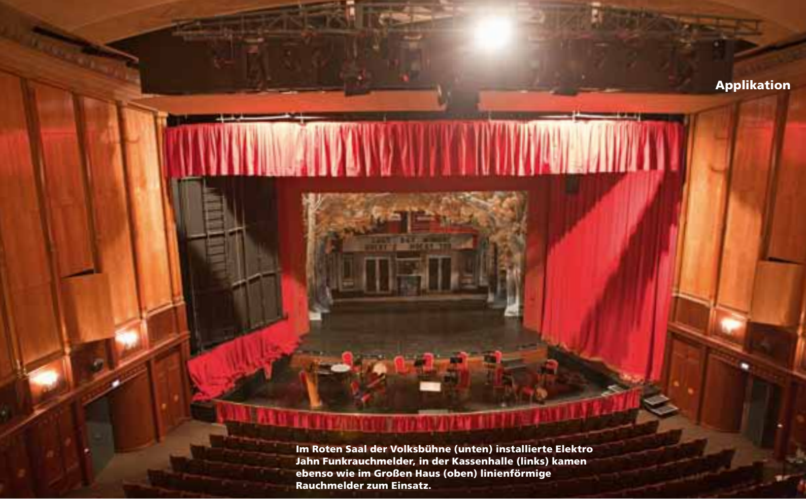
Im Roten Saal der Volksbühne (unten) installierte Elektro Jahn Funkrauchmelder, in der Kassenhalle (links) kamen ebenso wie im Großen Haus (oben) linienförmige Rauchmelder zum Einsatz.