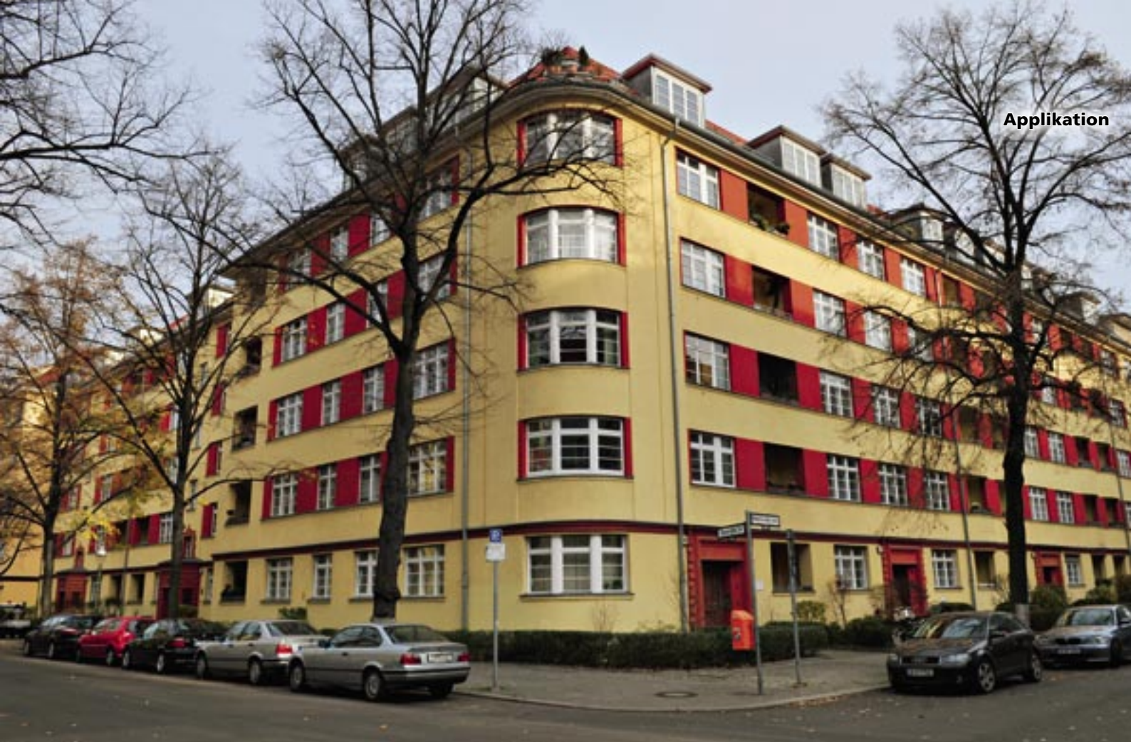
In einem sechs Häuser umfassenden Wohnblock in Berlin sind die Treppenhäuser und Kellergänge (rechts) mit Rauchwarnmeldesystemen von Hekatron ausgestattet worden.