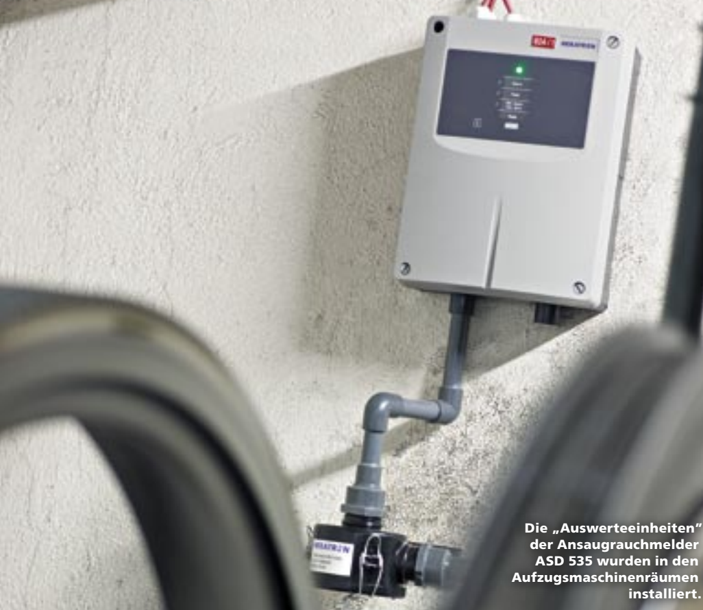
Die „Auswerteeinheiten“ der Ansaugrauchmelder ASD 535 wurden in den Aufzugsmaschinenräumen installiert.